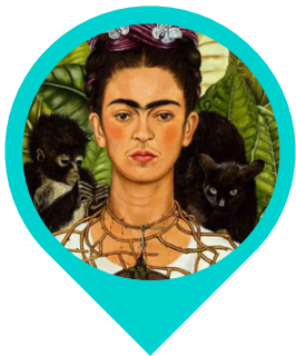
Frida Kahlo "Flores coloridas"