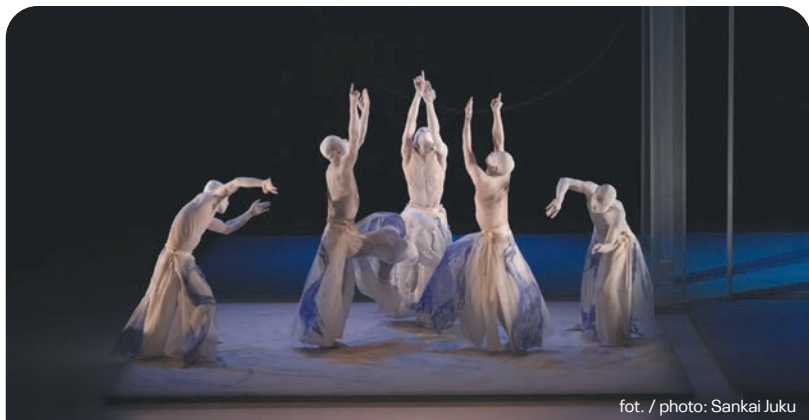
fot. / photo: Sankai Juku